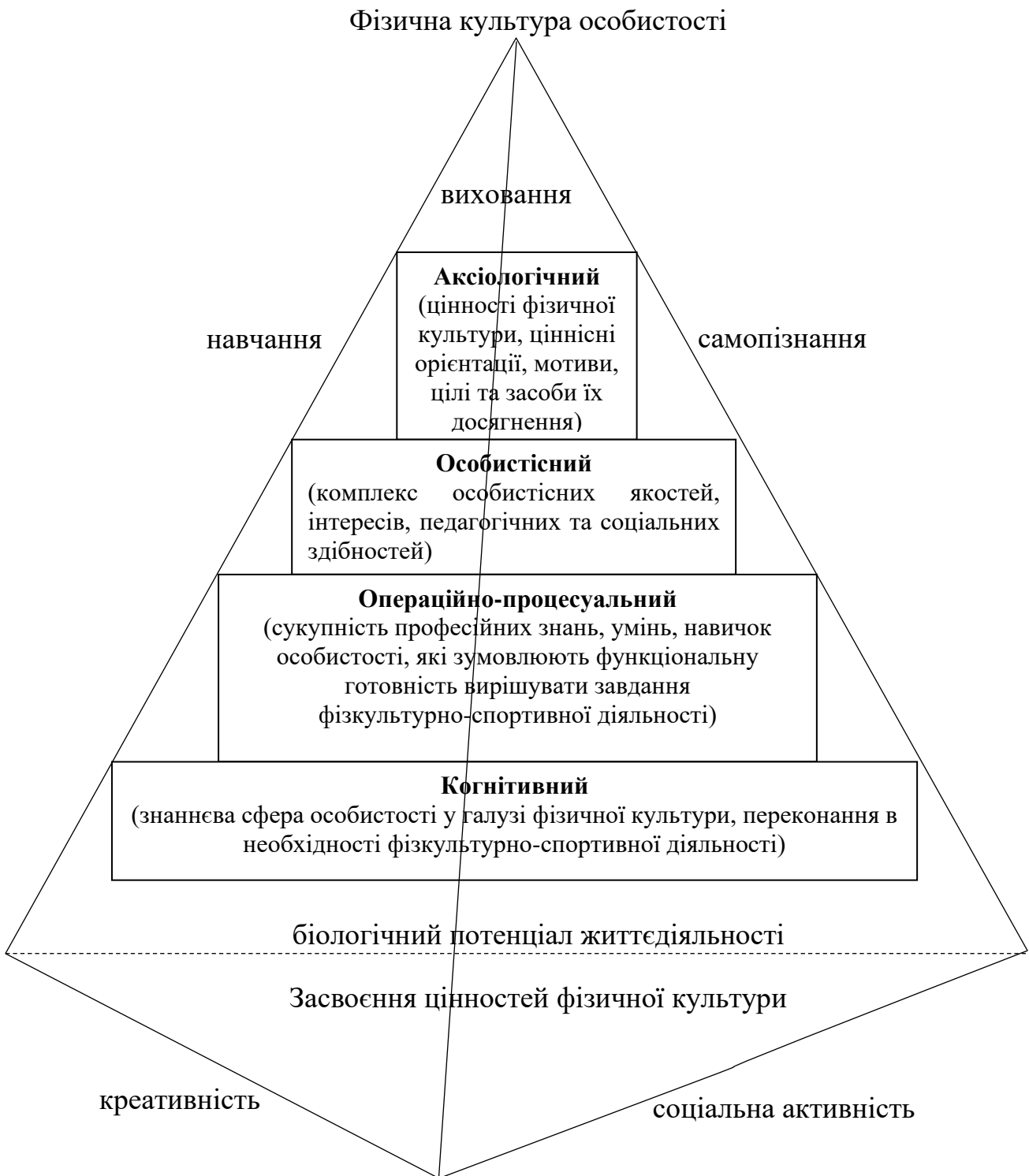
Рис.2. Структурні компоненти фізичної культури особистості фахівця фізичного виховання та спорту і піраміда її індивідуального розвитку в навчально-виховному процесі