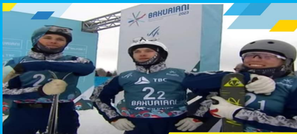
Історична бронза українських фристайлістів на ЧС-2023