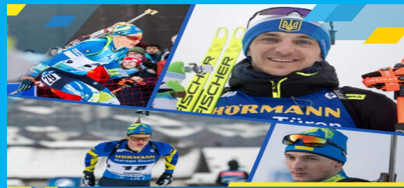
Склад збірної України на мас-старти ЧС-2023