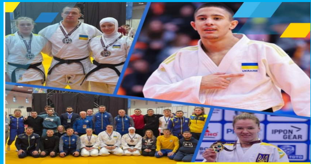
П'ять нагород українських дзюдоїстів на Кубку Європи